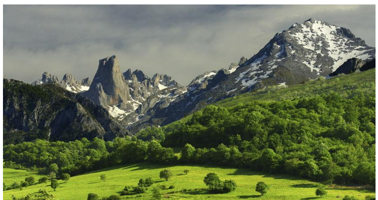
Figura 4. Picos de Europa