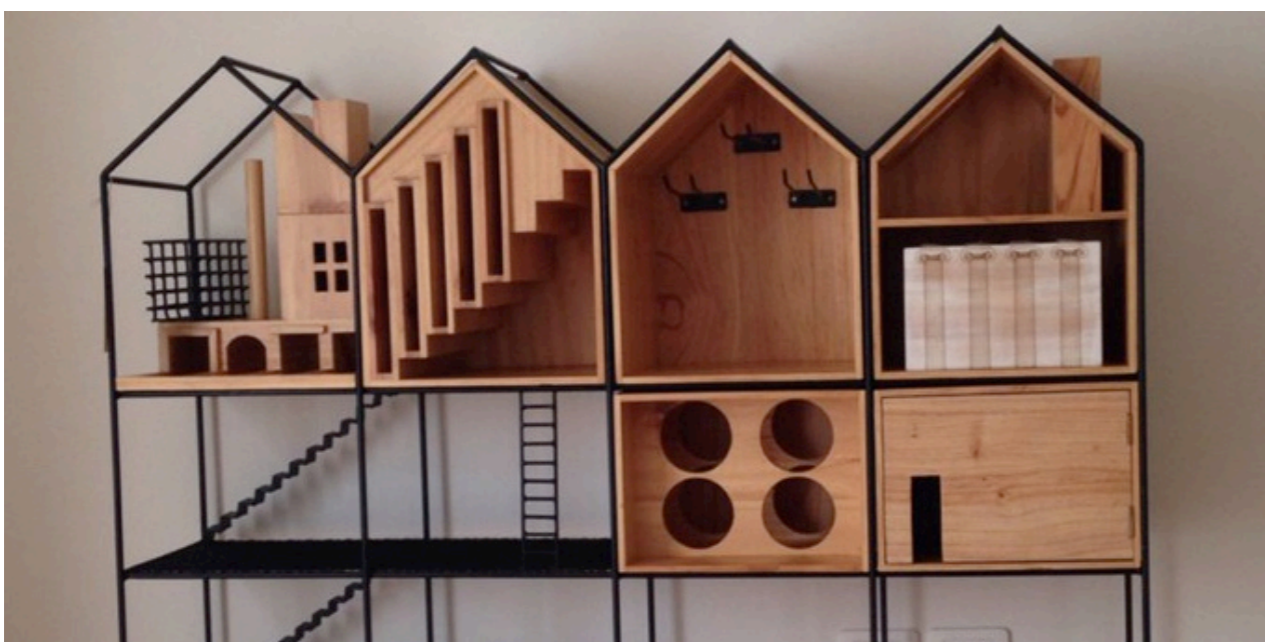
Armario Baan Dinner.