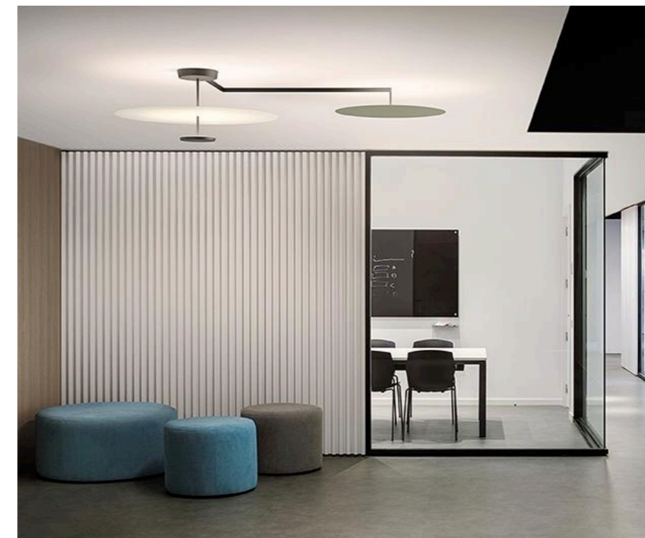
Deseño de Ichiro Iwasaki para Vibia

2.2. Partindo da análise e comentario crítico anteriores, faga unha proposta de deseño para unha lámpada de pé con dúas luminarias que poidan servir tamén como moble./ Partiendo del análisis y comentario crítico anteriores, haga una propuesta de diseño para una lámpara de pie con dos luminarias que puedan servir también como mueble. (7 puntos: bosquejos/bocetos 2, proposta/propuesta final 3, presentación 2)